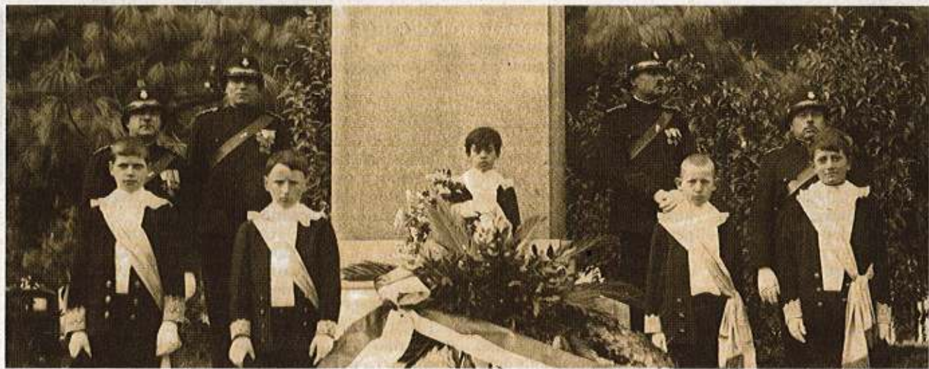
In un'altra foto d'archivio un momento dei festeggiamenti in occasione della cerimonia per la statua di Fogazzaro